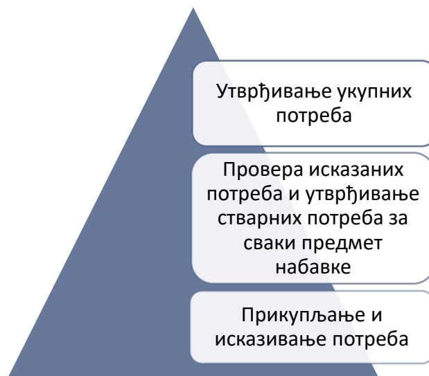
Слика бр. 3: Процес утврђивања потреба у фази планирања јавних набавки

За поступак планирања задужено је једно лице, у оквиру Одељења за правне и кадровске послове – дипломирани правник за правне, кадровске и административне послове, које непосредно обавља све послове јавних набавки, а приликом припреме и израде плана јавних набавки сарадњу остварује са шефом рачуноводства у Одељењу за економско – финансијске послове, а по потреби и са другим службама у делу прикупљања и усаглашавања о исказаним потребама, нарочито код набавки медицинског, лабораторијског и санитетског материјала. Запослено лице нема сертификат Службеника за јавне набавке.