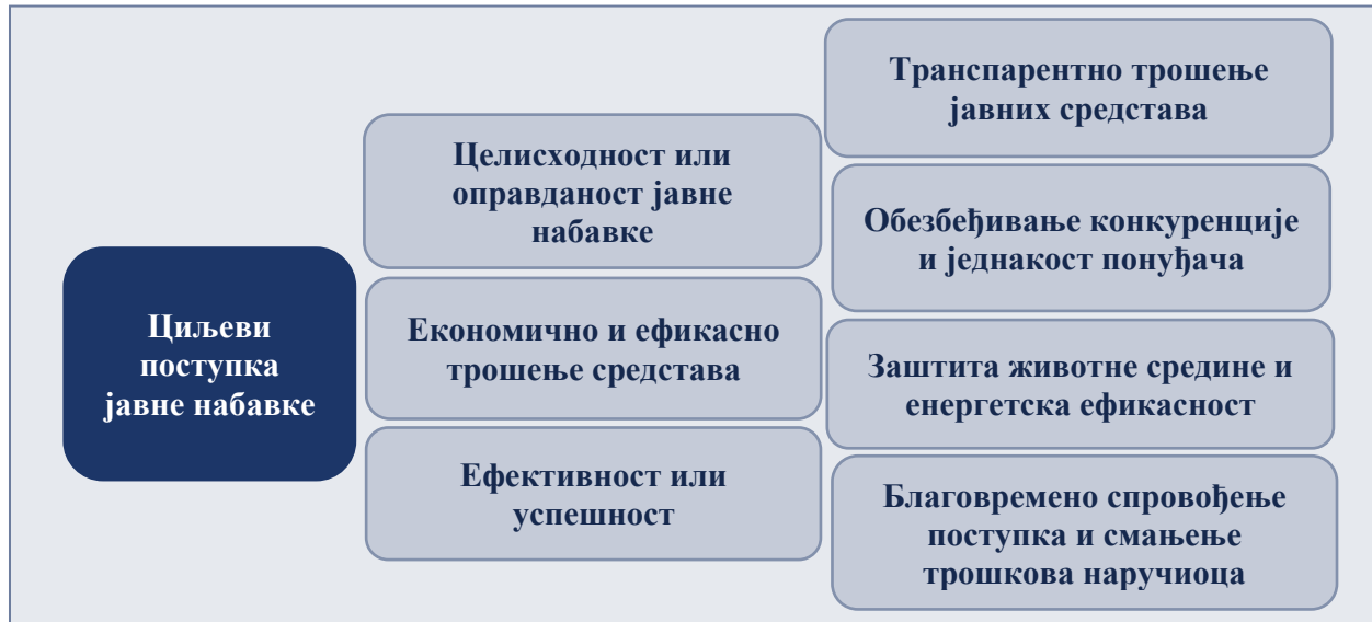
Слика бр. 1: Приказ циљева поступка јавне набавке 29

Наручилац је дужан да посебним актом ближе уреди начин планирања, спровођења поступка јавне набавке и праћење извршења уговора о јавној набавци (начин комуникације, правила, обавезе и одговорности лица и организационих јединица), као и начин планирања и спровођења набавки на које се закон не примењује. 30 Овим актом, који је сваки наручилац у обавези да донесе, уређују се циљеви поступка јавне набавке и повезане процедуре унутар сваког наручиоца, као и даља конкретизација начела јавне набавке утврђених у ЗЈН. 31