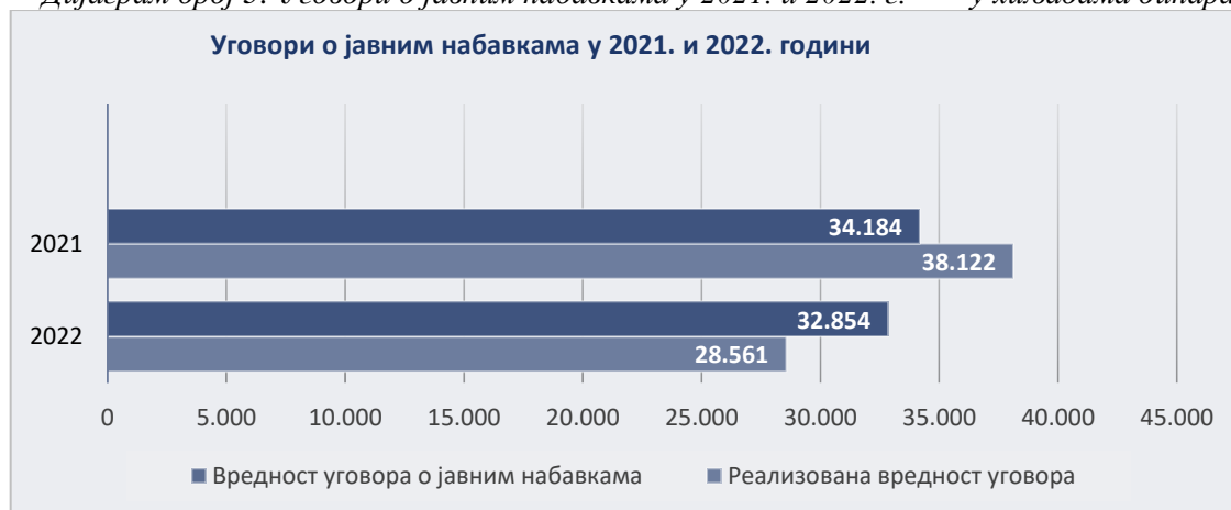
Дијаграм број 3: Уговори о јавним набавкама у 2021. и 2022. г. у хиљадама динара

Дом здравља је у 2021. години реализовао 112% уговорене вредности закључених уговора о јавним набавкама, а у 2022. години 87% уговорене вредности закључених уговора о јавним набавкама. 70